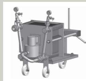
HOBRACOL 400 VS